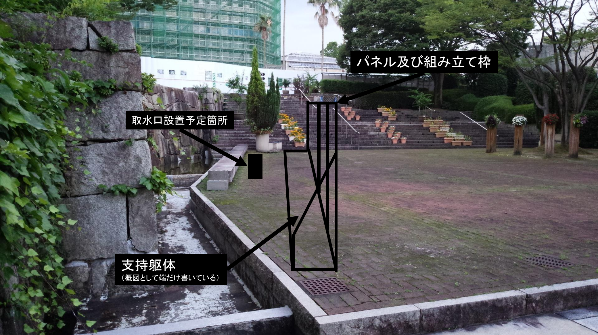
図5 壁面花壇設置イメージ図 側面図